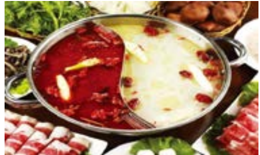
대표적인 휘귀 모습